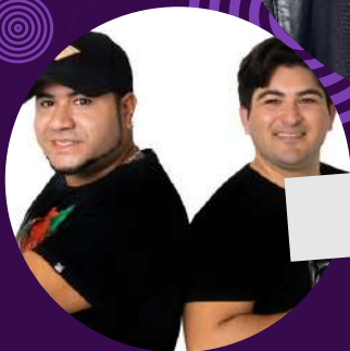
BARÕES DA PISADINHA